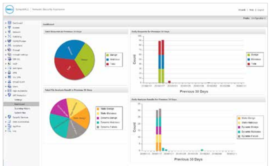
Le tableau de bord du service Dell SonicWALL Capture affiche le nombre de fichiers malveillants et anodins filtrés au cours des 30 derniers jours.

Déploiement rapide des signatures correctives : lorsqu'un fichier est identifié comme étant malveillant, une signature est immédiatement mise à la disposition des pare-feux ayant un abonnement à Dell SonicWALL Capture pour empêcher toute infiltration plus poussée. Le malware est alors soumis à l'équipe Dell SonicWALL de renseignement sur les menaces pour y être analysé plus en profondeur et intégré aux bibliothèques de signatures de l'antivirus au niveau de la passerelle et de l'IPS. Il sera en outre envoyé dans les 48 heures aux bases de données d'URL, d'IP et de réputation de domaine.